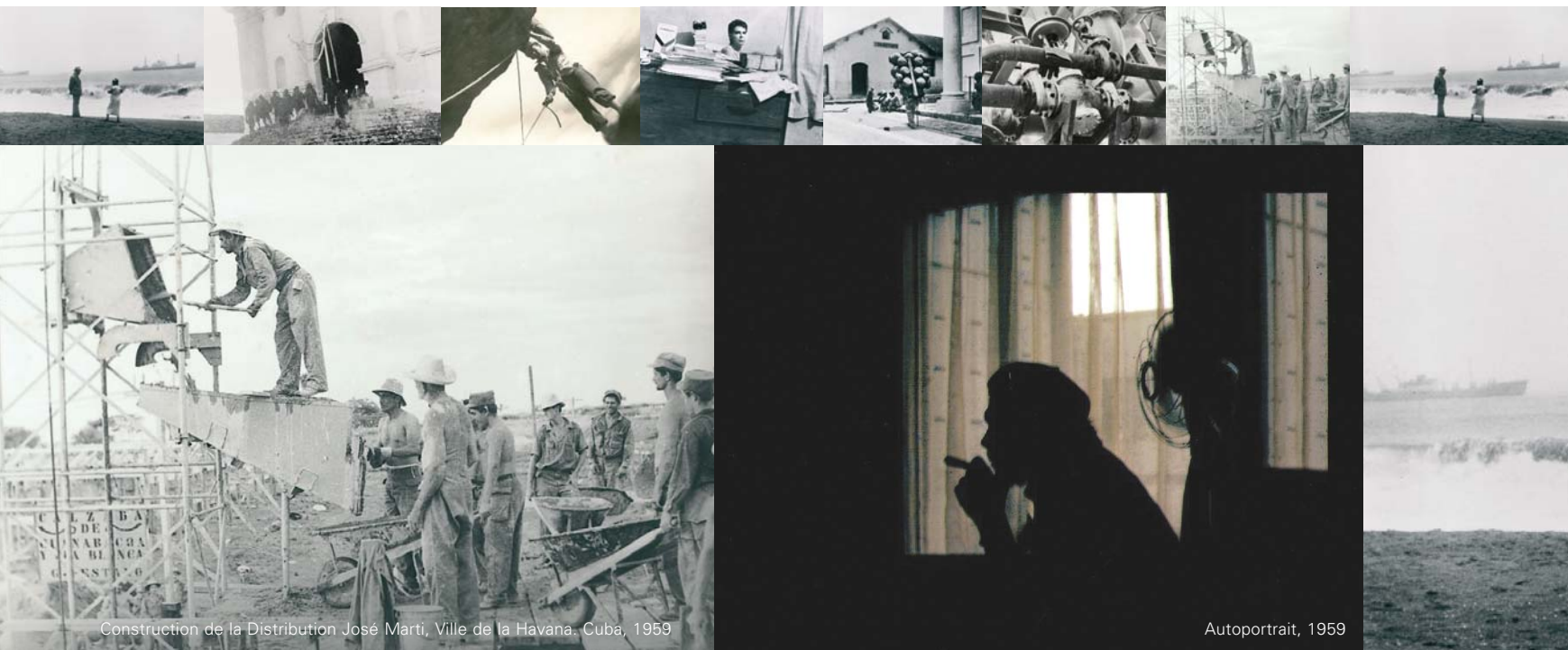
Construction de la Distribution José Martí, Ville de la Havana. Cuba, 1959