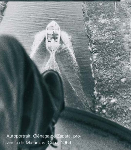
Autoportrait. Ciénaga de Zapata, provincia de Matanzas. Cuba, 1959