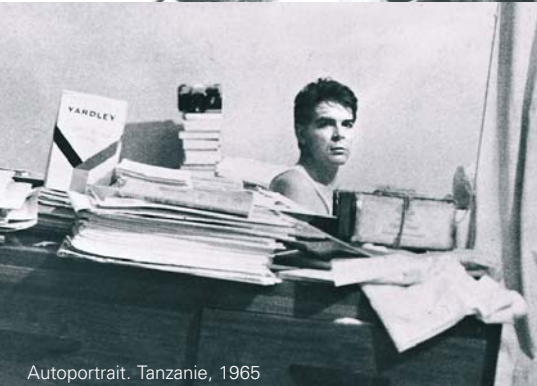
Autoportrait. Tanzanie, 1965